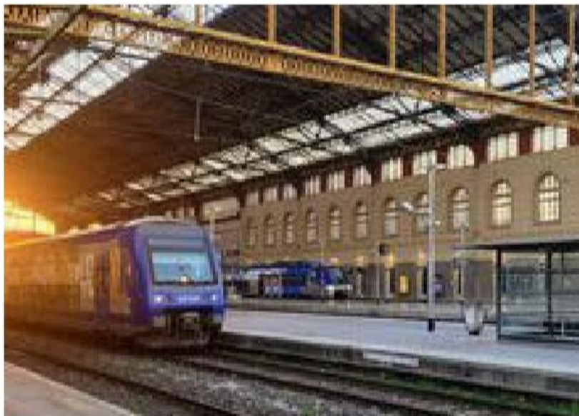
La gare Saint-Charles, épicentre du trafic ferroviaire en Paca, va connaître de grandes transformations dans la prochaine décennie avec la création de voies souterraines.

Une ligne de train existe, mais elle n'est pas exploitée pour le trafic voyageur et sous-utilisée pour le fret. Sa réouverture permettrait de mieux desservir les bassins est-ouest de la Métropole et d'envisager la constitution d'un vrai réseau métropolitain entre Marseille, Aix et Rognac. L'accès à des zones d'activités majeures, comme celles de Vitrolles, Marignane, Les Milles ou Plan d'Aillane,