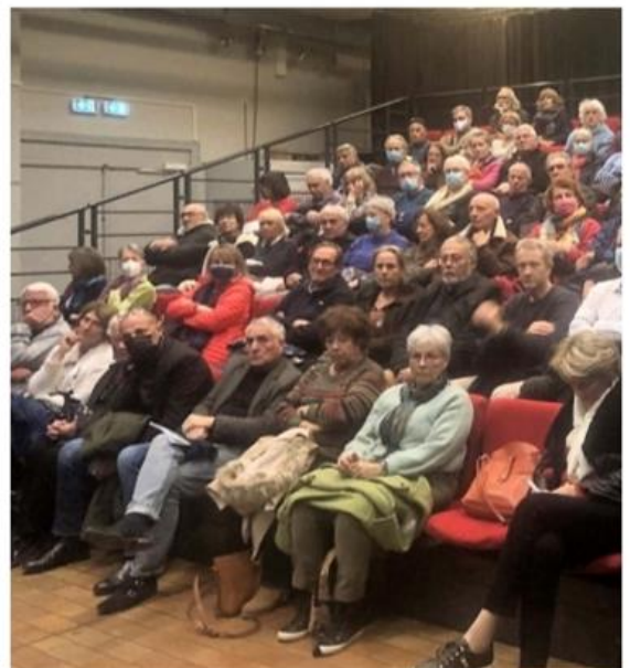
Plus de 80 personnes sont venues dire oui au train à Venelles mercredi dernier.