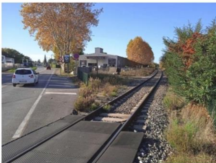
Un projet similaire à celui demandé par le Carrefour citoyen et les Venellois a été accepté par la SNCF à Toulouse.