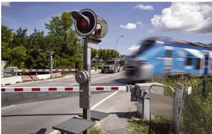
Dix trains par sens et par jour passent à Venelles, la moitié sur Pertuis et l'autre moitié en direction des Alpes.

Pour résumer, trois options sont proposées : un seul quai, mais avec un passage à niveau fermé longtemps, y compris par rapport au rond-point qui est un peu plus loin ; deux quais avec des interrogations sur le 2 e quai qui est en cours et peut être plus difficile à mettre en place ; la 3 e option, un seul quai plus un si-