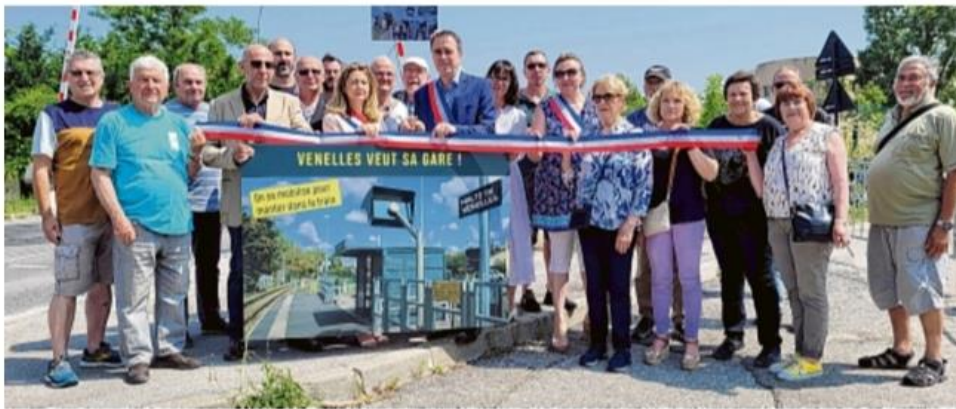
Hier matin, Arnaud Mercier, le maire de Venelles, invitait élus et citoyens à l'inauguration fictive de la halte ferroviaire.

À ses côtés, des administrés et membres de l'association Carrefour citoyen, à l'origine de la pétition qui a relancé le projet, mais aussi élus du conseil municipal de Venelles et du Puy-Sainte-Réparate, ainsi que la députée Anne-Laurence Petel (Renaissance). Alors que vendredi soir, la proposition de loi portée par son collègue, Jean-Marc Zulesi (8 e circonscription), sur les RER métropolitains était adoptée par l'Assemblée nationale en première lecture, Anne-Laurence Petel met-