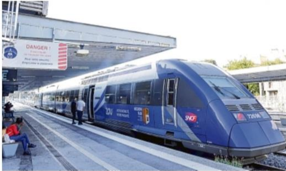
La desserte Marseille-Briançon fait partie des points noirs dénoncés par les usagers. Priorisée par les pouvoirs publics, elle devrait offrir à l'avenir des trajets de 3 heures, contre 4h30 actuellement.