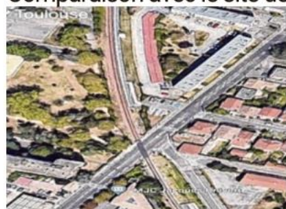
La halte Gallieni-Cancéropole de Toulouse réalisée en 2009 (à g.). Deux quais sont situés du même côté de la voie ferrée, de part et d'autre du passage à niveau.