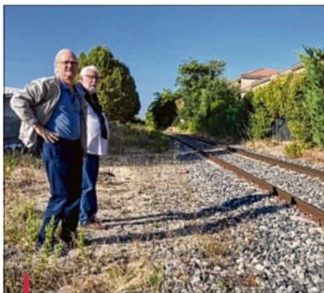
Les membres du Carrefour citoyen, association porteuse de la pétition, espèrent rapidement voir pousser un quai sous leurs pieds.